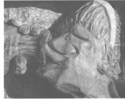
Eine Frau schaut zu tief ins Glas

Stellen sie sich vor, sie stehen irgendwo vor einem Baumstumpf. Sie drehen sich einmal rundum. Nun überlegen sie sich, was wohl der Baumstumpf aus seiner Perspektive aus alles sehen würde. Komisch, unvorstellbar, so folgen sie uns hinauf zum Restaurant Stählibuck. Mit Blick in drei Schritten: das Handwerk – das Ergebnis – die Beurteilung.