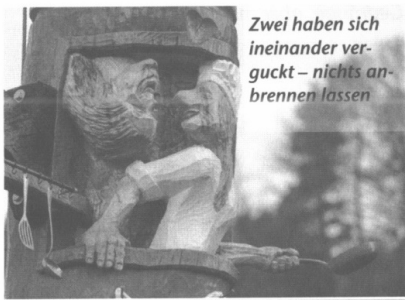
Zwei haben sich ineinander ver- guckt – nichts an- brennen lassen

Das Ergebnis – Persönliche Überzeugung Wegleitend für den Erfolg mit seinen «Figuren» ist wohl die innere Einstellung zum Holz, gepaart mit der Absicht, die vorhandenen, gewachsenen Strukturen vom Objekt einzubeziehen. Allein schon seine Abkehr nach 14-jähriger Tätigkeit als Maschineningenieur zeigt, dass er einerseits mit Holz die Betrachtenden zu Gedanken auffordern will und andererseits seine eigene Sicht ausdrücken möchte. Wie er selber sagt: «Alle Figuren sind so gespannt auf ihre Befreiung aus dem Baum, dass es sie vor Freude ein wenig zerreißt.»